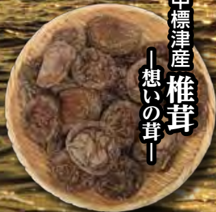
中標津産 椎茸 — 想いの茸 —