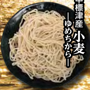
中標津産 小麦 — ゆめちから —