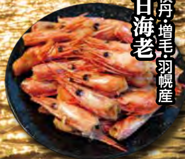
積丹・増毛・羽幌産 甘海老