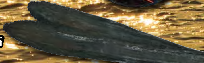
知床羅臼産 羅臼昆布