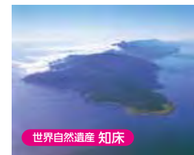
世界自然遺産 知床

道東観光の玄関口。100km圏内には知床・摩周湖・屈斜路湖・阿寒湖・野付半島・釧路湿原など見どころ満載!東京(羽田)は100分、札幌(千歳)は60分。空港から市街地までは車で8分の近さ。遠いけどすぐに行けちゃう中標津!