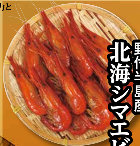
野付半島産 北海シマエビ